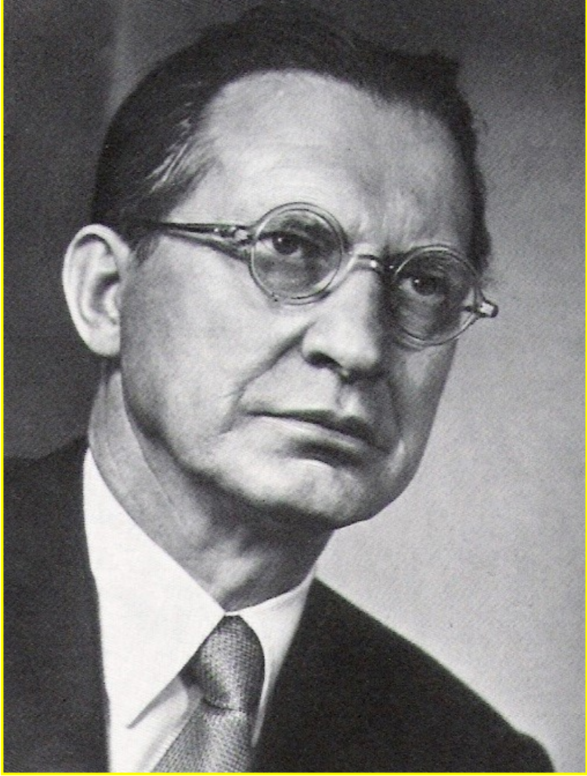
ALCIDE DE GASPERI

Soltanto voglio parlare del retaggio europeo comune, di quella morale unitaria che esalta la figura e la responsabilità della persona umana col suo fermento di fraternità evangelica, col suo culto del diritto ereditato degli antichi, col suo culto della bellezza affinate attraverso i secoli, con la sua volontà di verità e di giustizia acuita da un'esperienza millenaria.