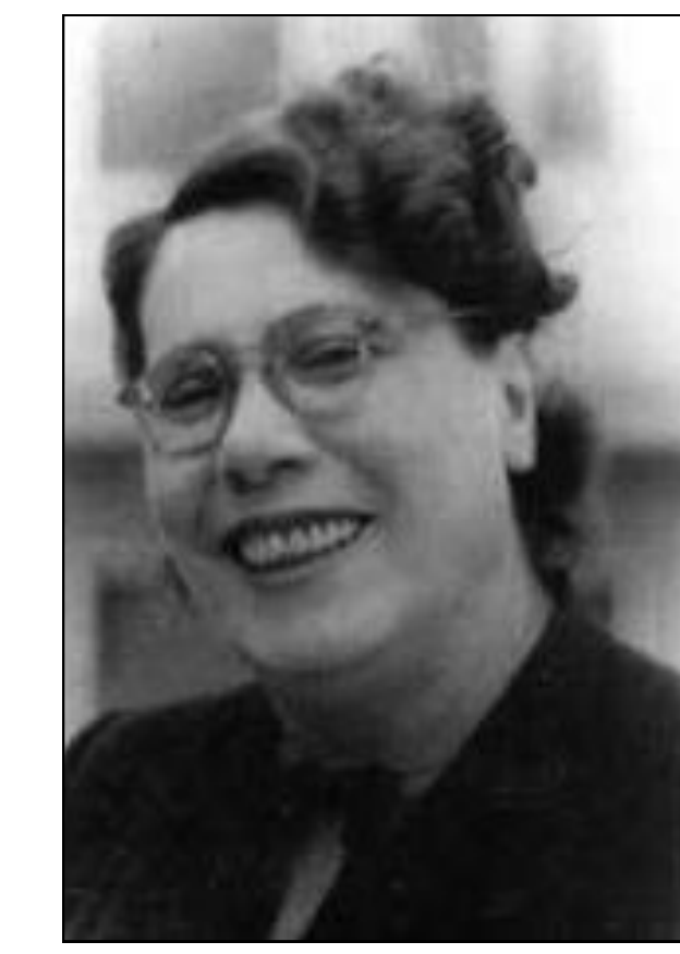
TERESA NOCE LONGO-PCI