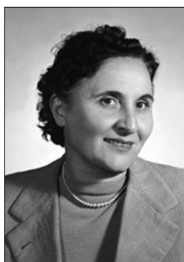
ADELE BEI PCI

L'Amministrazione Comunale vuole ricordare il giorno "in cui le donne si presero la Storia" con i 21 volti delle giovani deputate che entrarono a far parte dell'Assemblea Costituente istituita con il preciso compito di dare alla neoletta Repubblica una costituzione libera e democratica.